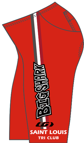
LEFT / GAUCHE