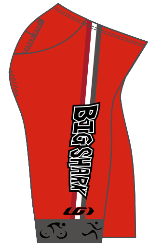
RIGHT / DROIT